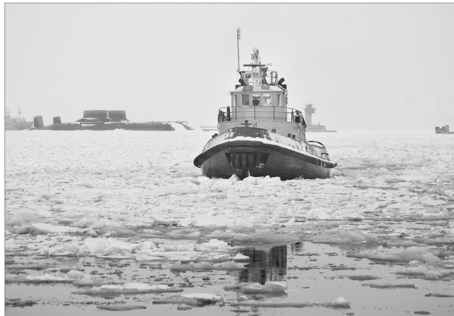
Через акваторию мчит буксир-кантовщик «Иван Харитонов»